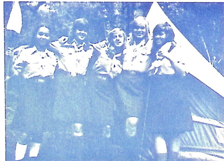
Az „Ötfejű sárkány” ős a léamerikai kcs. öv.-képző táborban.