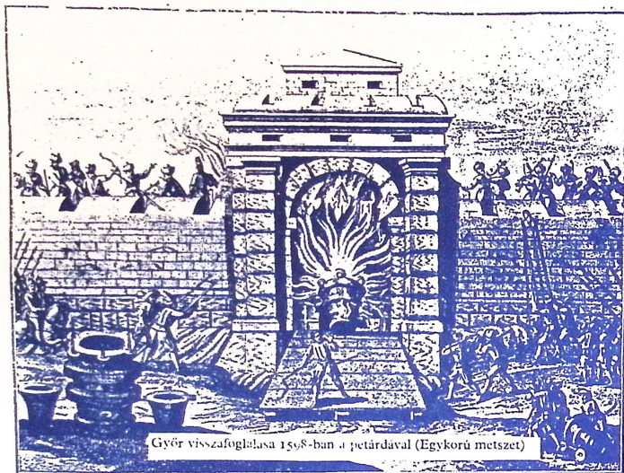
Győr visszafoglalása 1568-ban a petárdával (Egykorú metszet)