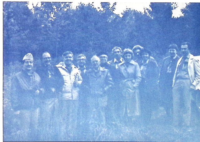
„Vezérkari” megbeszélésre gyűltek össze 1982 őszén a Sik Sándor cserkészparkban a képen látható vezetők. A legidősebb témá a gödöllői jamboree ötven éves jubileumának megünneplése volt.

Azért lehetett olyan szép és hibátlan, mert benne az egész nemzet résztvett. Nem volt csak cserkészügy. Milyen nagyszerű lenne, ha az idén augusztus 4-e és 10-e közt az egész szabadföldön élő magyarság szíve és lelke a Sik Sándor cserkészpark felé repülne, Gödöllőre gondolva. Segítené, támogatná. Résztvenne. Vagy legalább érdeklődne.