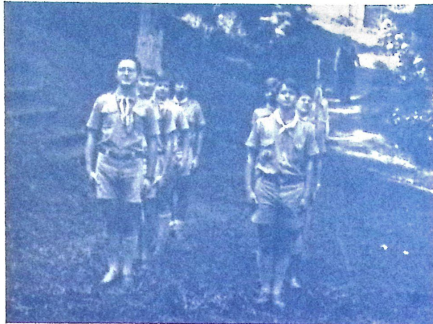
A Kenguru és a Fekete hollé ős zászlófelvonás előtt a délamerikai kcs. öv.-képző táborban.