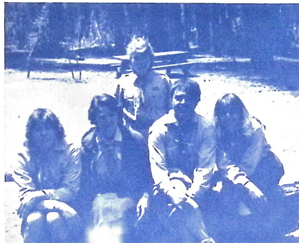
A kaliforniai nagytábor vezetőinek egy csoportja.