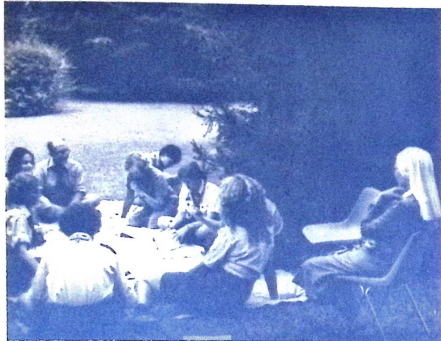
A Corvina-tábor Platanoson, Argentínában.